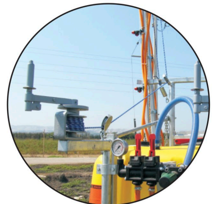
Levante de poleas

1 Filtro de aspiración con válvula automática de retención