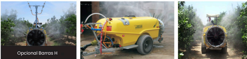
Opcional Barras H

Chasis de alta resistencia galvanizado en caliente