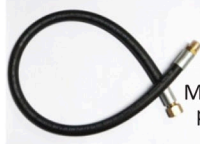
300-003 Manguera negra de alta pres. de 3/4 - 1 malla bomba - comando.