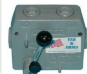
Válvula reguladora prince guaneadora RD-150-16