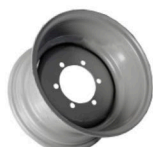
Aro p/neumatico 11L-15 6 agujeros int 101 mm