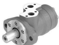
Motor hidráulico BR-315 eje 32 mm