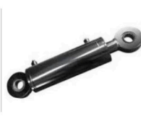
17301 Cilindro hidráulico Arado 60x30x200