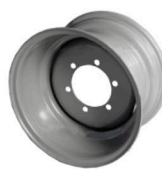
Aro p/neumatico 11L-16 6 agujeros int 142 mm