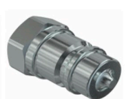
75962 ACOPLE RAPIDO 75962