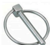
10523 Pasador anilla abatible 11 mm pin de enganche