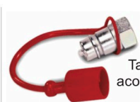
Tapa de protección para acople rápido macho de 1/2