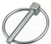
10521 Pasador anilla abatible 9 mm - pin de enganche