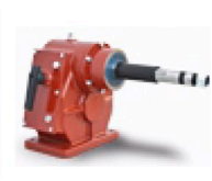
Caja Multiplicadora CMV Elivent 1: 3.5 - 1:4.5