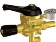
17020623 Comando Braglia M 170 en bronce 60 BAR