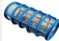
C00100012 Filtro cartucho para filtro de 1 1/2 mesh 50