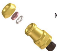
M 75 Porta boquilla regulable puntera