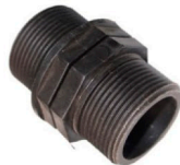
8056351 Unión simétrica de 1 1/2"