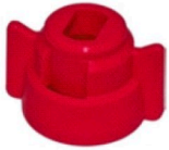
8253012 Tapa porta boquilla TR roja