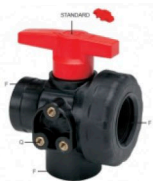
8216364 Válvula de bola de 3 vías 1 1/2"