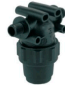
8110002 Filtro de línea 1/2 NPT 75 l/m