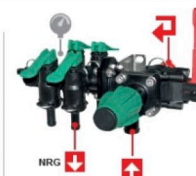
8374033 Comando Star 06 de dos vías