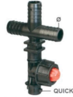
8235015 Porta boquilla polipropileno tipo X