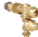
8268009 Porta boquilla duplo con cañón regulable