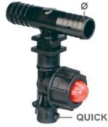
8235009 Porta boquilla polipropileno tipo T