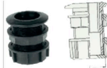
8051351 Kit salida de descarga 1 1/2 con tapón