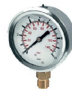
8302107 Manómetro de glicerina inox 0/60 Bar 870 psi